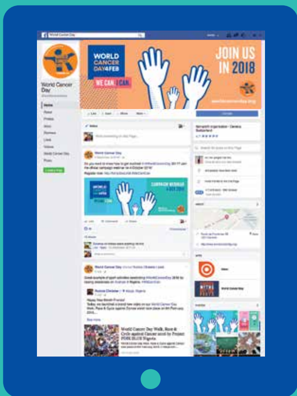
FOTO DE CAPA DE FACEBOOK

Para receber as últimas notícias e atualizações, 'curta' a página oficial do Dia Mundial do Câncer no Facebook.