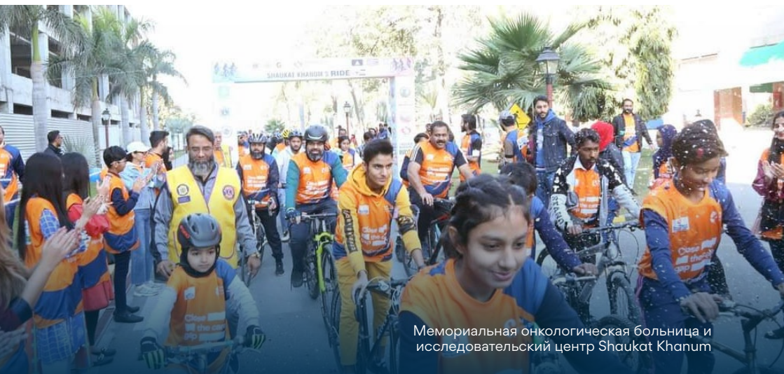
Мемориальная онкологическая больница и исследовательский центр Shaukat Khanum