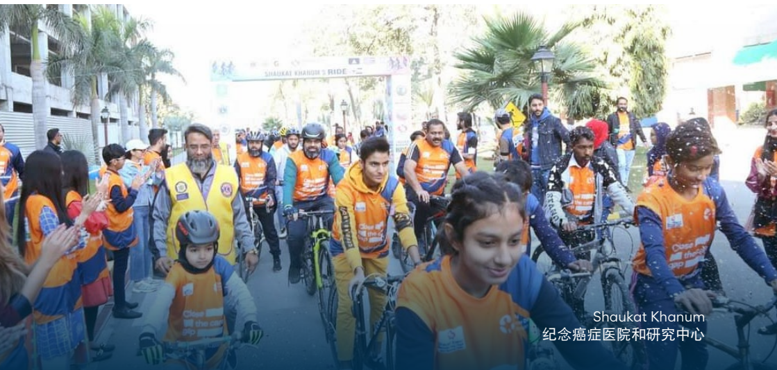
Shaukat Khanum 纪念癌症医院和研究中心