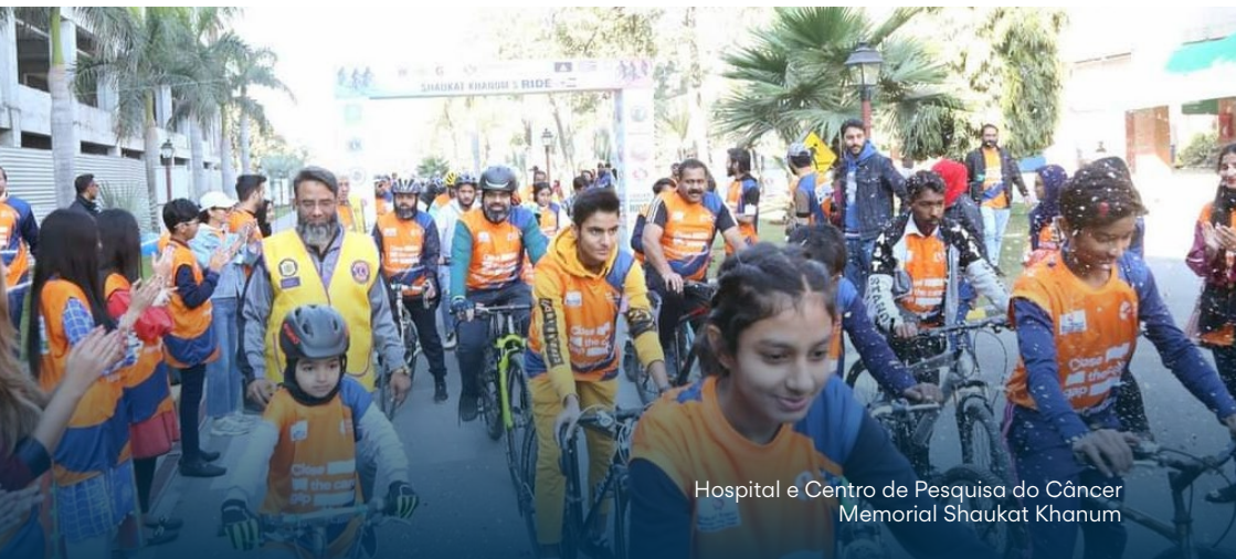
Hospital e Centro de Pesquisa do Câncer Memorial Shaukat Khanum