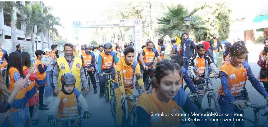
Shaukat Khanum Memorial-Krankenhaus und Krebsforschungszentrum